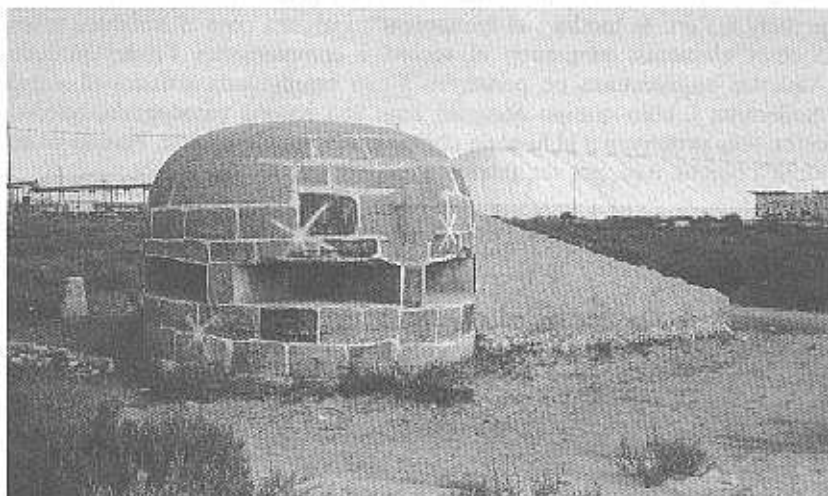
Búnker de tres espitlleres. Salines

Tot el conjunt d'arquitectures defensives analitzat tenia un fi clar: pretenia, al marge de la protecció dels bombardejos, vigilar, controlar i albirar l'enemic i, en el seu cas, detenir-lo o repel·lir-lo, almenys durant el conflicte. Però una vegada acomplert aquest objectiu, quan la reguitzell de construccions tàctiques quedava sota un únic càrrec militar, seguia realitzant un altre fi, diferent a l'anterior, però tan real com el primer: l'efecte de la por, ja que els qui tenien la maquinària de la guerra, i l'arquitectura que la suportava, tenien també el poder i la capacitat de destruir. El mateix informe militar constata aquestes intencions.