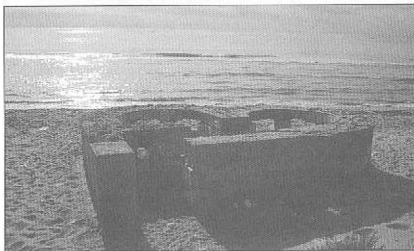
Bunker en construcció, Platja del Tamarit

A Santa Pola trobem encara en peu alguns d'aquests búnkers -també anomenats trinxeres pels santapolers- al llarg de la costa. Se situen a la platja del Tamarit, a la platja de Llevant, i a la zona del Carabassi, ja dins del terme municipal d'Elx. Aquests últims eren els encarregats de controlar l'entrada a l'interior per la zona del clot de Galvany i lo Brisó.